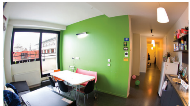
Colocation à la Maison-des-Étudiants (CROUS)

Adressez-vous directement à votre espace Campus France qui traitera votre demande en liaison avec le « pôle logement » du CROUS.